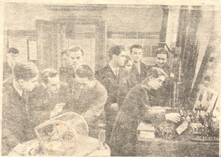
В Москве состоялось совещание секретарей комсомольских организаций и молодых передовиков предприятий сельскохозяйственного машиностроения и тракторостроения, созданное ЦК ВЛКСМ и Министерством машиностроения СССР.

За 36 лет Советская Армия и Военно-Морской Флот с честью прошли тяжелый путь жестоких боев с врагами социалистического государства и превратились в несокрушимую силу нашего времени. Это хорошо знают и наши враги. Впитавшая в себя богатейший опыт Великой Отечественной войны, оснащенная лучшей в мире боевой техникой и обладающая высоким морально-боевыми качествами, Советская Армия непоколебимо стоит на страже государственных интересов социалистической державы. Она всегда готова сокрушить любого агрессора, посягнувшего на честь, свободу и независимость великого советского народа.